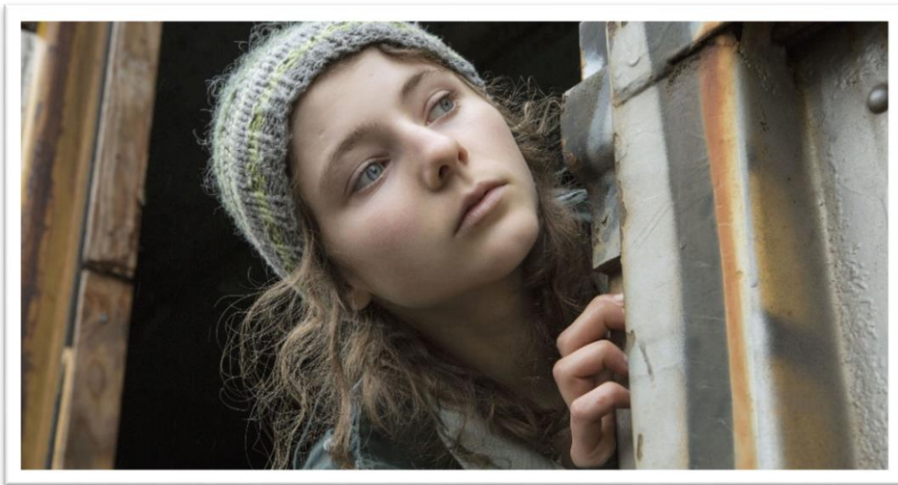
Leave no Trace (2018) Debra Granik

Samarbeidet med Tromsø filmfestival er videreført i 2018, og forbundets nye klassiker, Rosemary's baby (1969) ble vist under festivalen. Det ble gitt reisestøtte til filmklubber som ville besøke festivalen og som samtidig deltok på forbundets seminar.