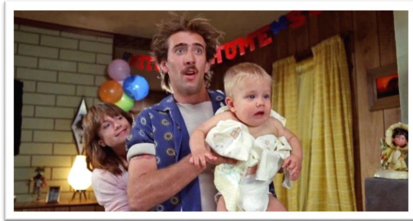
Raising Arizona (1987) Joel og Ethan Coen